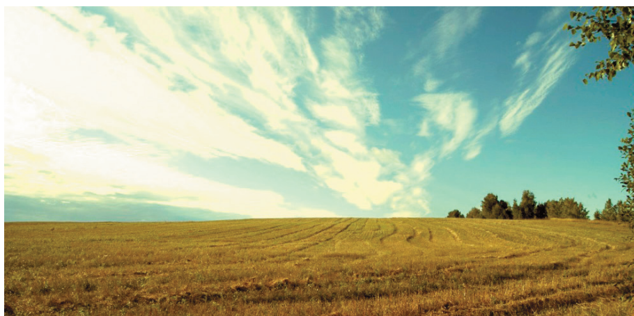
Рис. 13 – Окрестности г. Уржум