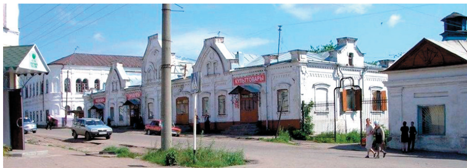
Рис. 7 – Купеческие ряды на центральной улице Уржума 10

Всего в городе и районе значатся 70 памятников культуры, истории и архитектуры федерального и регионального значения, самый известный – ансамбль Свято-Троицкого собора. Он был построен на месте разобранного собора с тем же названием. Окончание постройки собора относится к 1900 г. Строительство осуществлялось в основном за счёт пожертвований верующих, в том числе крупных лесопромышленников. Се-