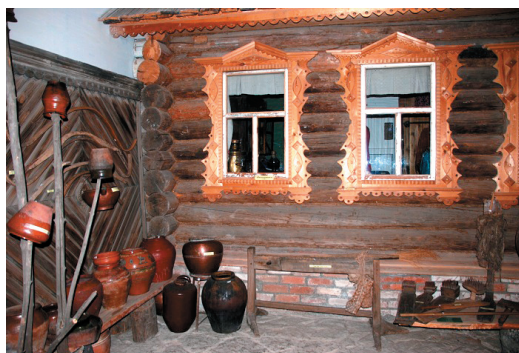
Рис. 10 – Фрагмент экспозиции Уржумского краеведческого музея 13

Fig. 9 – The building of the real school in Urzhum (built in 1912)