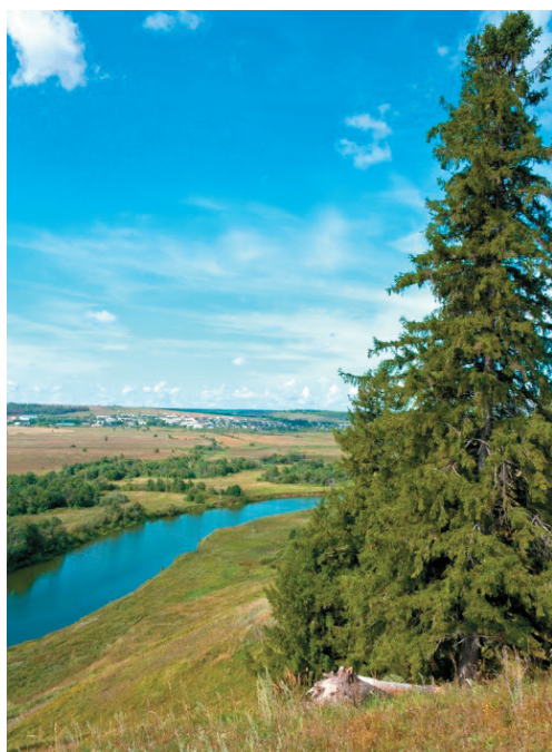
Рис. 1 – Вид на Уржум с Атрысовской горы 4

Fig. 1 – Urjum view from Atriasovskaya Mountain