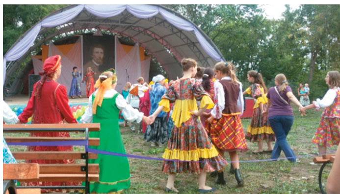
Рис. 11 – Васнецовские хороводы (август 2016 г.)

Fig. 11 – Vasnetsovsky round dances (August 2016)