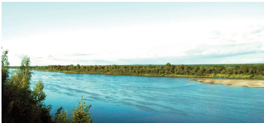
Рис. 12 – Река Вятка в окрестностях с. Русский Турек

сателя от поездки в Русский Турек было множество, ведь село славилось большими ярмарками – в воскресный день сюда съезжались крестьяне со своими самыми разнообразными товарами из соседних деревень. Прекрасные воспоминания об этом селе оставил брат писателя Иван Трифонович Твардовский: «Богатейшее село стояло на правом берегу судоходной Вятки. Места эти были тогда необычайной красоты: простор широчайший, много зелени, пойменных лугов, цветов, лесов, и сам воздух ничем не замутнен – свежесть и прозрачность удивительные. И народ там какой-то особенный – добродушный, гостеприимный и... поголовно песенный. Да как поют! Диво дивное!» 14 . В Русском Туреке сохранился дом, где жила