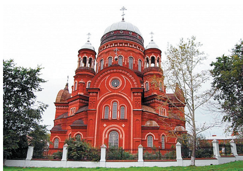
Рис. 8 – Троицкий собор в Уржуме в нач. XX в. и в наши дни 11

Fig. 8 – Trinity Cathedral in Urzhum in the beginning of XX century and in our days