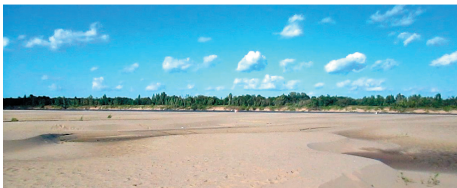
Рис. 14 – пляж на Вятке в с. Русский Турек