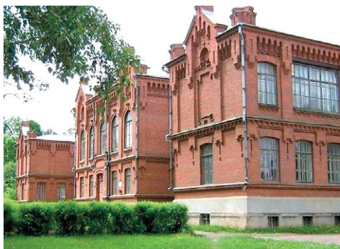
Рис. 9 – Здание реального училища в г. Уржум (постр. в 1912 г.) 12

В течение ряда лет в Уржуме в конце лета проводятся «Васнецовские хорово-