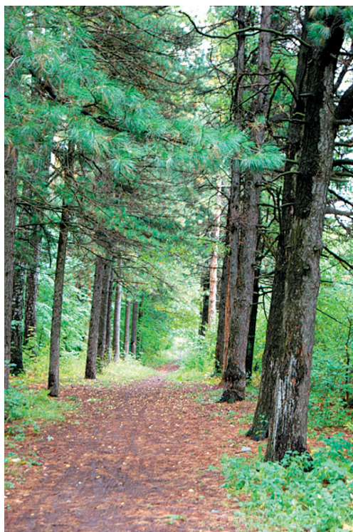
Рис. 6 – Кедровая аллея и парк в усадьбе Бушковых сегодня

Fig. 6 – Cedar alley and park in the Bushkovs' estate today