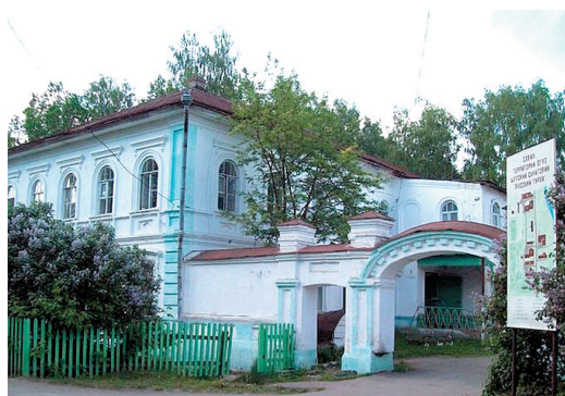
Рис. 5 – Усадьба Бушковых в с. Русский Турек 7

Fig. 4 – House of M. Bushkov in Russian Turek