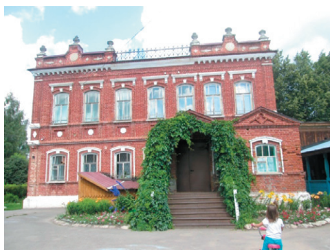
Рис. 4 – Дом М. Бушкова в с. Русский Турек

Fig. 3 – The mansion of S. Shamov in Urzhum