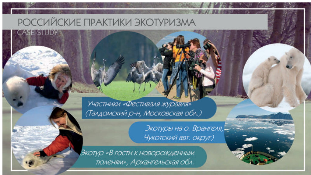
Рис. 4 – Примеры успешных российских практик развития экотуризма

ры успешных практик развития экотуризма (рис. 4).