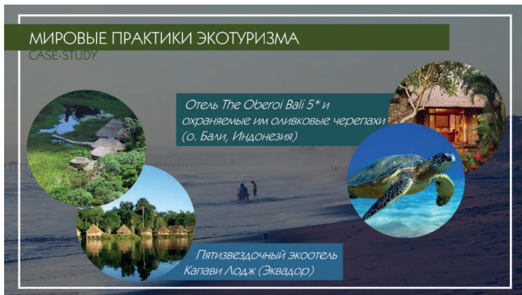
Рис. 3 – Примеры успешных локальных практик развития экотуризма в мире

Ниже рассмотрим несколько успешных локальных примеров реализации принципов экологичности при организации туристских программ (рис. 3).