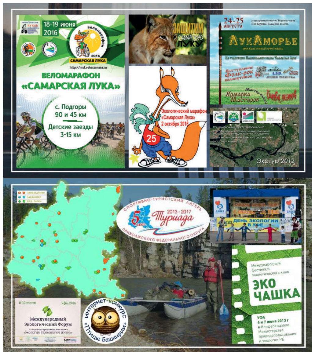
Рис. 5 – Примеры событийных экотуристских мероприятий в Приволжье

Fig. 5 – Examples of event-based ecotourism activities in the Volga region