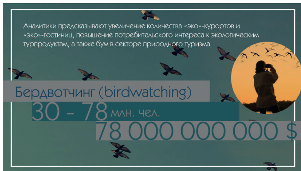
Рис. 1 – Бердвотчинг – один из наиболее популярных в мире видов экотуризма

Все эти, а также множество иных разновидностей природного экологического туризма далеко не всегда вписываются в широко распространённые понимания пределов экотуризма. И исследований, в которых бы предпринимались попытки обобщить весь имеющийся спектр видов экотуристской деятельности, к сожалению, ни в мировой, ни в российской практике, нет.